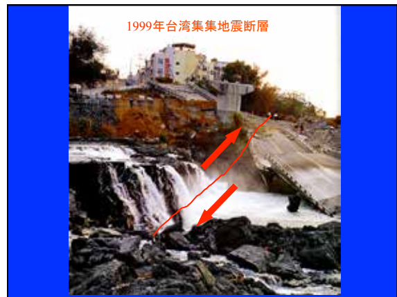
1999年台湾集集地震断層