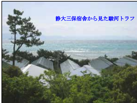
静大三保宿舎から見た駿河トラフ